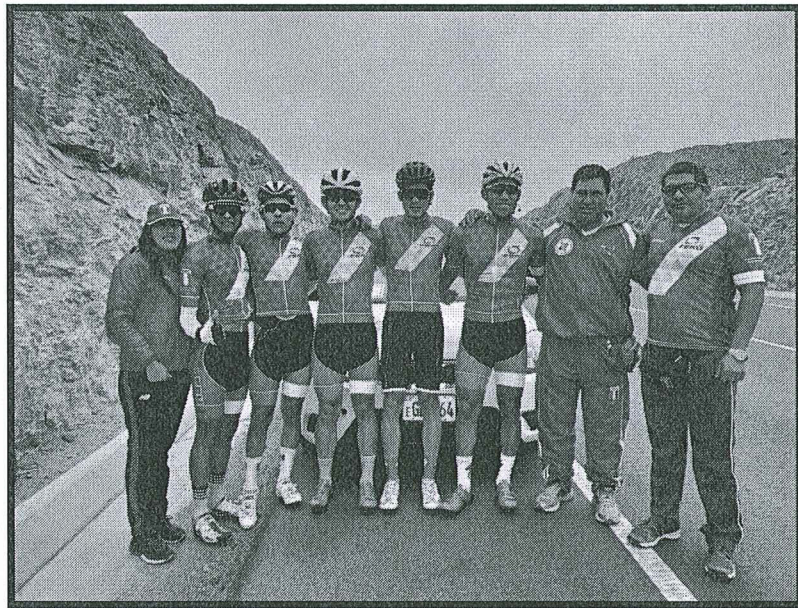
Grafico 3: Selección nacional de ciclismo de ruta.