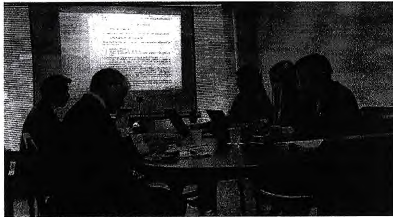
Imagen 2. Sesión de la Comisión Cuarta "De Economía"