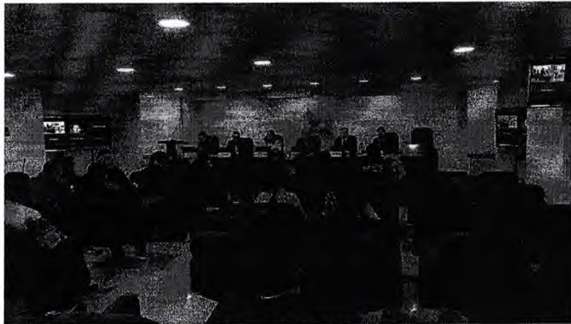
Imagen 3. Sesiones plenarias