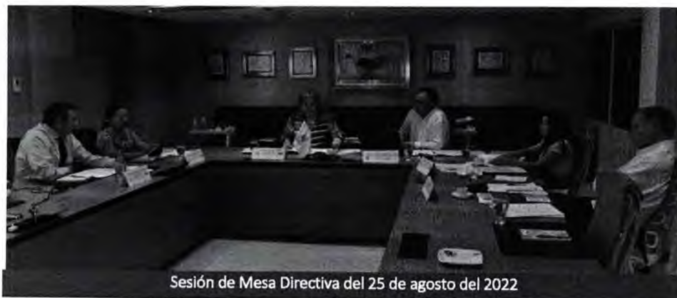
Sesión de Mesa Directiva del 25 de agosto del 2022

Asimismo, se tramitó y derivó a Comisiones los proyectos de pronunciamiento presentados, y se procedió a debatir la agenda para el período de sesiones correspondiente al mes de noviembre.