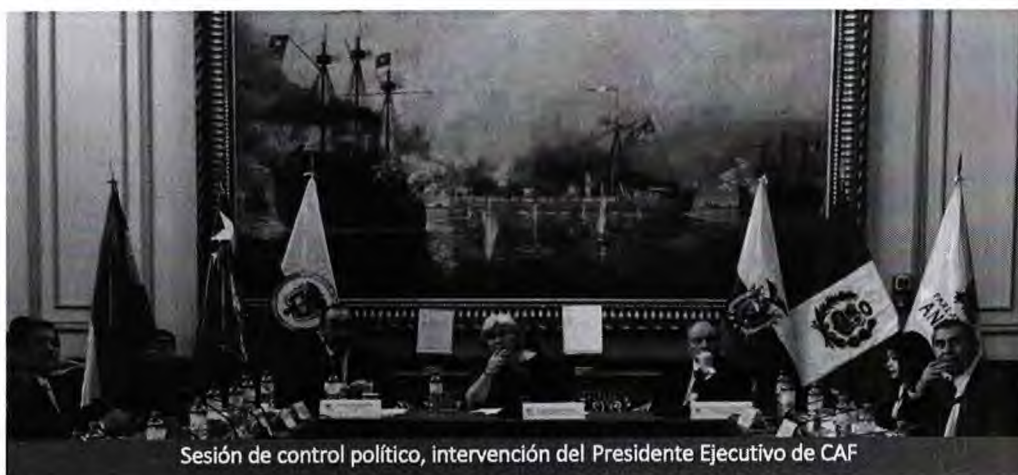
Sesión de control político, intervención del Presidente Ejecutivo de CAF

desde CAF se busca impulsar una integración que vaya más allá de lo comercial y de lo físico, promoviendo que exista una integración regulatoria, productiva, financiera y ambiental.