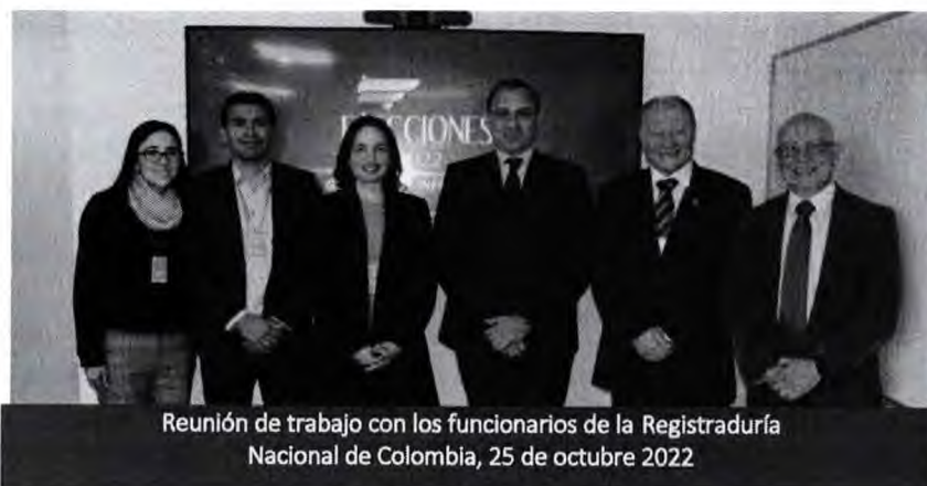
Reunión de trabajo con los funcionarios de la Registraduría Nacional de Colombia, 25 de octubre 2022

Este modelo puede ser replicado en el Perú ya que su certeza y rapidez daría mayor confianza a los ciudadanos sobre resultados de futuros procesos electorales nacionales y subnacionales. Culminada la reunión, se acordó continuar la colaboración entre el Parlamento Andino y la Registraduría Nacional para mejorar las prácticas del sistema electoral de nuestros países, buscando generar predictibilidad sobre los resultados electorales, aspecto fundamental para construir democracia.