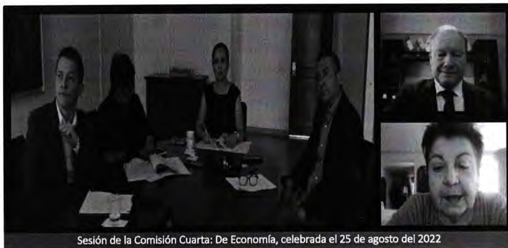
Sesión de la Comisión Cuarta: De Economía, celebrada el 25 de agosto del 2022

Si bien este proyecto busca evitar la evasión a través del uso de paraísos fiscales, es necesario analizar el por qué estos recursos van a parar a dichas jurisdicciones. Por ello, resulta fundamental establecer mecanismos de control para hacer frente a los altos niveles de pérdida de recursos por corrupción, que en el último año le ha costado al Perú más de S/ 24 mil millones, dinero que en muchas ocasiones termina en paraísos fiscales 1 .