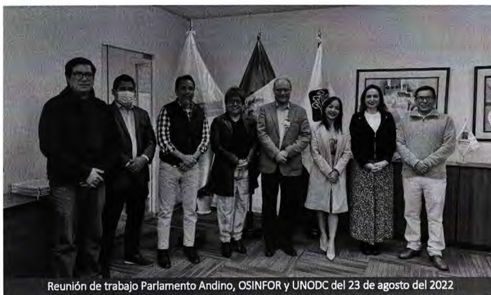
Reunión de trabajo Parlamento Andino, OSINFOR y UNODC del 23 de agosto del 2022

También se discutió la posibilidad de trabajar algunos proyectos piloto con base en iniciativas binacionales. Una opción a mediano plazo es elaborar un proyecto conjunto entre Perú y Ecuador, y otra, a corto plazo, es entre Perú y Colombia. En ese sentido, se acordó presentar esta última propuesta a la delegación del Parlamento Andino de Colombia durante la sesión ordinaria que se realizará en Lima, en septiembre.