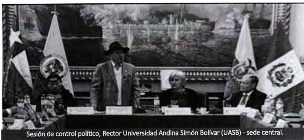
Sesión de control político, Rector Universidad Andina Simón Bolívar (UASB) - sede central.

En relación con el fortalecimiento de la Universidad, indicó que el nuevo estatuto ha permitido mayor integración, pues ahora el Consejo Superior tiene representación de los cuatro estados que forman la CAN. Además, señaló que el estatuto de la Universidad dispone que en los países donde no hay sede nacional se contará con oficina de enlace. En el caso del Perú, esta oficina se encuentra en la sede de la Secretaría General.