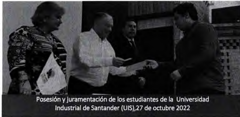
Posesión y juramentación de los estudiantes de la Universidad Industrial de Santander (UIS), 27 de octubre 2022