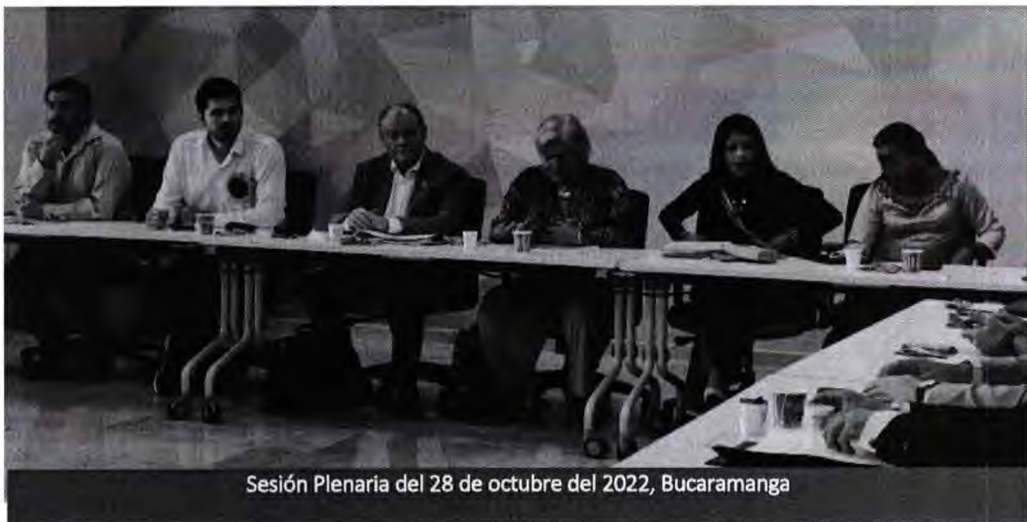
Sesión Plenaria del 28 de octubre del 2022, Bucaramanga