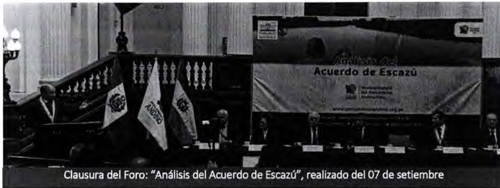
Clausura del Foro: "Análisis del Acuerdo de Escazú", realizado del 07 de setiembre