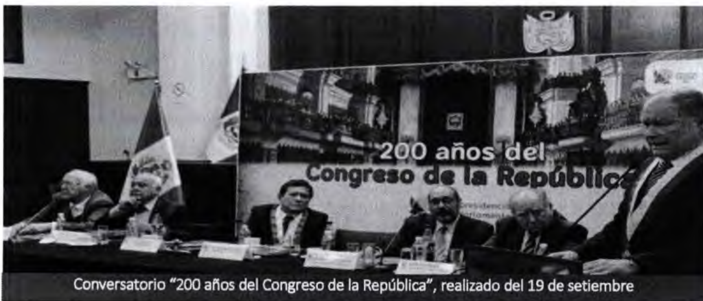
Conversatorio "200 años del Congreso de la República", realizado del 19 de setiembre

Durante este Conversatorio, se resaltó la importancia del Congreso de la República como organismo representativo de la población, su origen, sus problemas y desafíos en los tiempos actuales.