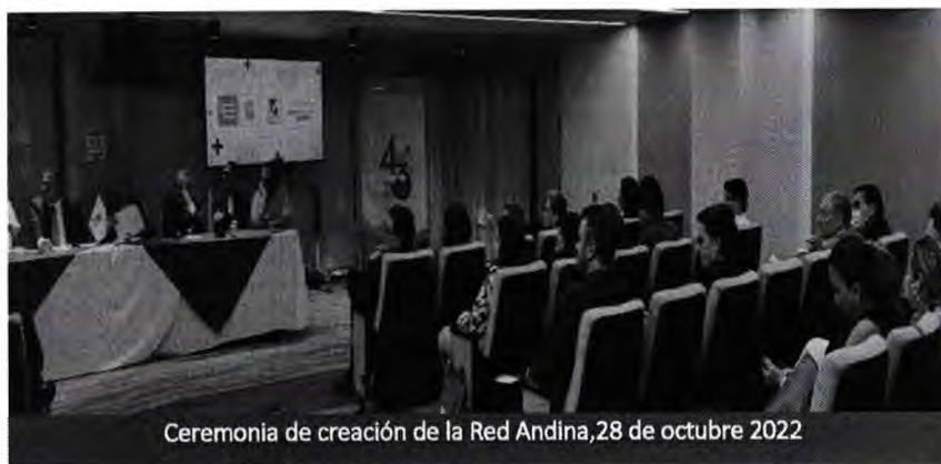
Ceremonia de creación de la Red Andina, 28 de octubre 2022

De otro lado, se firmó un convenio de colaboración académica, científica y cultural entre el Parlamento Andino y la Universidad Complutense de Madrid. Este convenio busca promover la investigación conjunta entre ambas partes y, específicamente, en el proyecto de creación y puesta en marcha de la Red Andina de Universidades Acreditadas, cuya finalidad, de un lado, es la integración educativa y el fortalecimiento investigador conjunto del Sistema Andino de Integración (SAI) a través de la acción del Parlamento; y de otro lado, el establecimiento de vínculos entre la CAN y las Universidades europeas a través de la Universidad Complutense de Madrid.