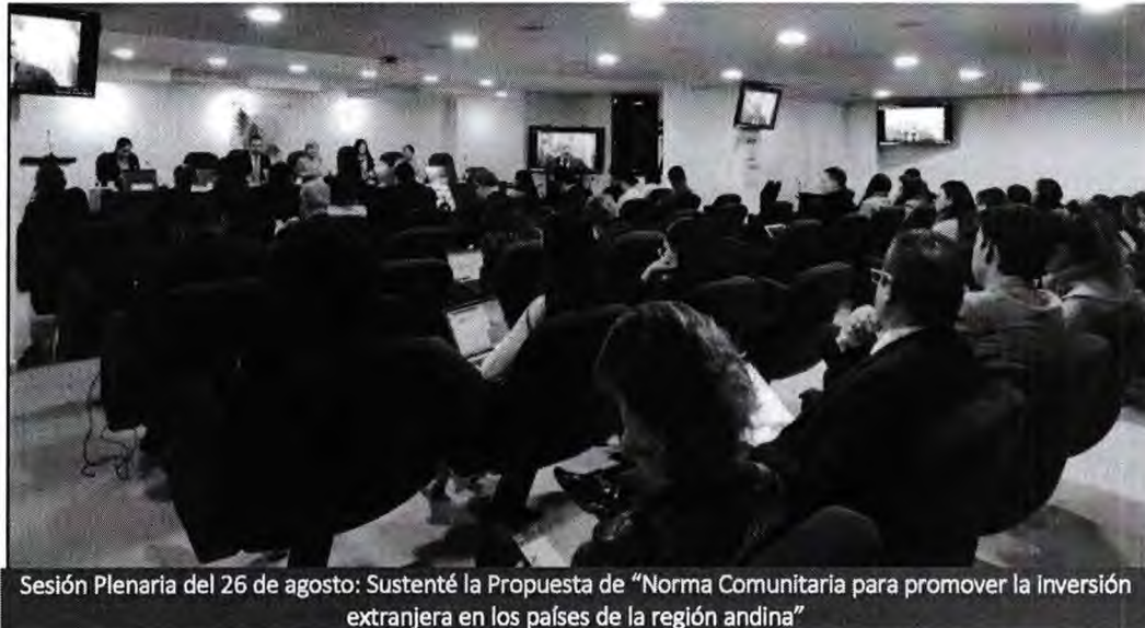
Sesión Plenaria del 26 de agosto: Sustenté la Propuesta de “Norma Comunitaria para promover la Inversión extranjera en los países de la región andina”

La IED es una de las principales fuentes de financiación externa para los países en desarrollo, como el nuestro. En ese sentido, resulta necesario contar con normativa que propicie la atracción de capitales extranjeros y que estos se ubiquen en sectores o áreas estratégicas que impulsen el desarrollo del país y la reactivación de nuestra economía, tal como lo recomienda el proyecto de Propuesta de Norma Comunitaria en mención.