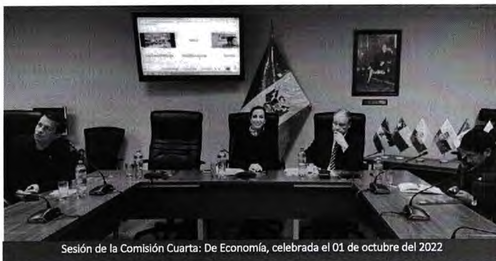
Sesión de la Comisión Cuarta: De Economía, celebrada el 01 de octubre del 2022