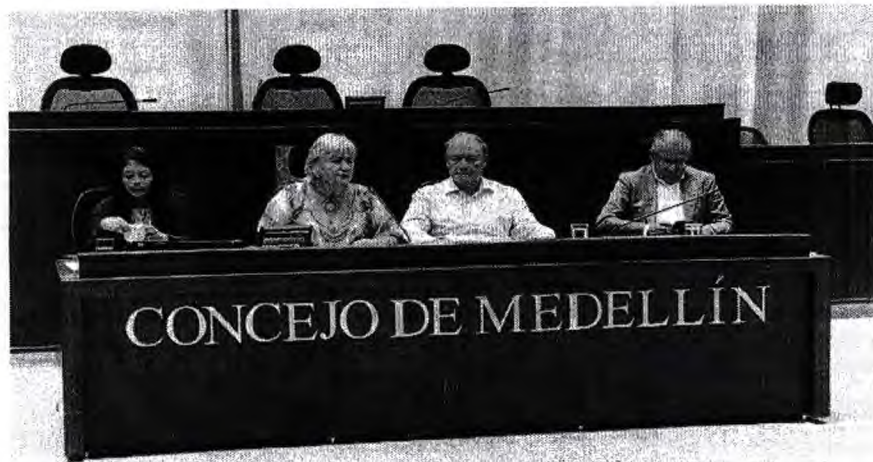
Imagen 5. Sesión plenaria en el Concejo de Medellín

Durante la exposición, la experta destacó la importancia que el Parlamento Andino aborde este tópico en su agenda ya que es una valiosa iniciativa para la protección del ambiente. Su exposición incidió en aspectos como son la ausencia de políticas públicas o regulación respecto a la tala o comercio ilegal, así como la importancia de la homologación de conceptos de tala ilegal a fin de evitar la migración de los taladores de de un país a otro en búsqueda de impunidad.