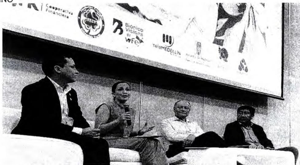
Imagen 3. Foro internacional de economía solidaria y cooperativismo