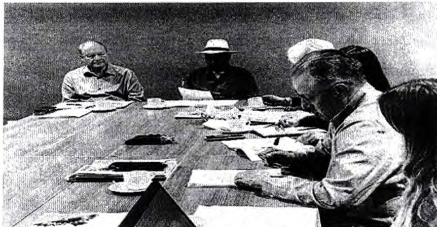
Imagen 1. Sesión de Mesa Directiva