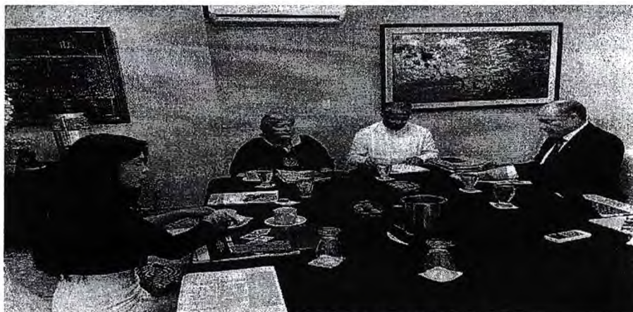
Imagen 1. Sesión de Mesa Directiva

Asimismo se tomaron acuerdos en torno a las siguientes actividades en las que se involucrará el Parlamento Andino, como son el Encuentro de Autoridades Territoriales, el Encuentro de Rectores Andinos y el Foro Regional de Migraciones para América Latina y el Caribe. Estos eventos serán espacios importantes donde se podrá evaluar el trabajo realizado por el Parlamento Andino en los tópicos de gestión gubernamental descentralizada, educación y migraciones, los cuales son de gran relevancia para el desarrollo de los pueblos andinos.