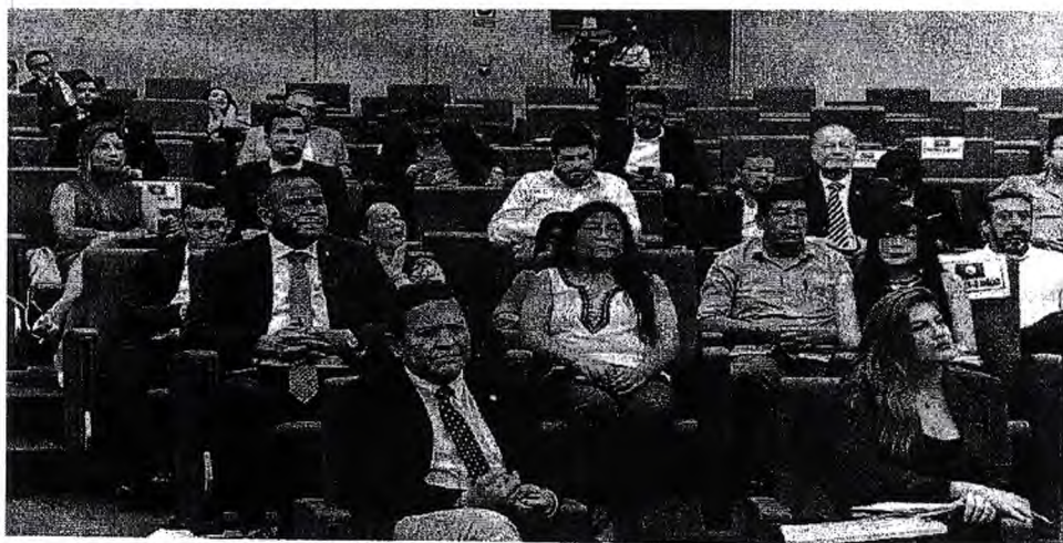
Imagen 4. III Encuentro Integración de la Integración

En este III Encuentro Integración de la Integración también participaron representantes del PARLATINO, Parlamento Centroamericano, Parlamento del MERCOSUR, así como de las Asambleas Nacionales de Honduras y Nicaragua.