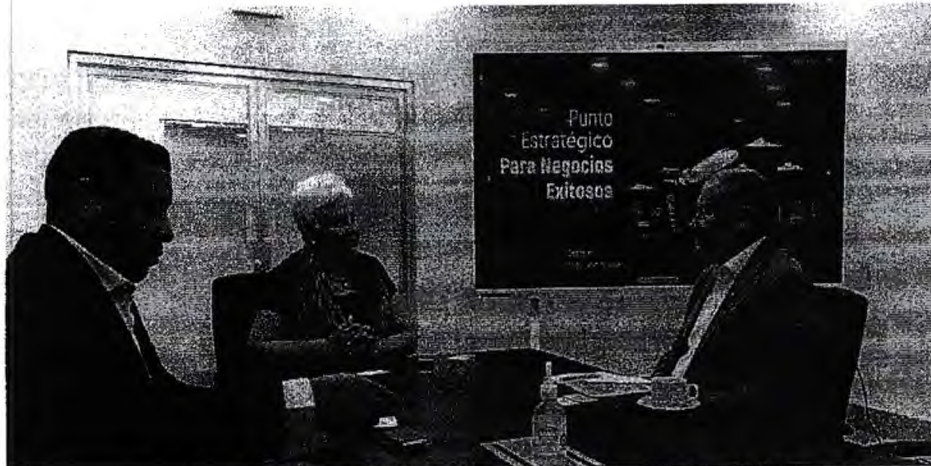
Imagen 5. Reunión con Gerente de Inteligencia Comercial de la Zona Libre de Colón

La valiosa información recibida permitirá continuar con la promoción de las Zonas Económicas Especiales en nuestro país, las cuales son herramientas eficaces de integración y activación económica. Para tal fin, se viene trabajando una propuesta de marco normativo sobre competitividad que incluya dentro de sus temáticas a las Zonas Económicas Especiales.