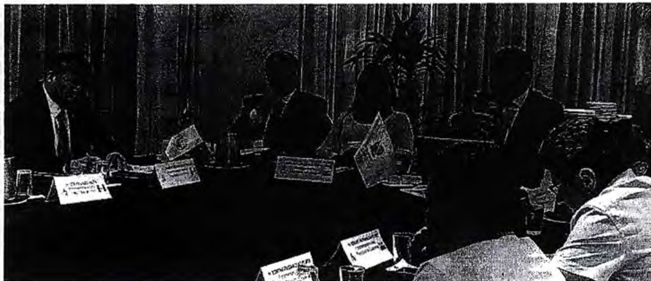
Imagen 2. Sesión plenaria

Después del debate parlamentario, se acordó considerar los puntos de vista expuestos por el experto y continuar el debate de la propuesta normativa en la siguiente sesión.